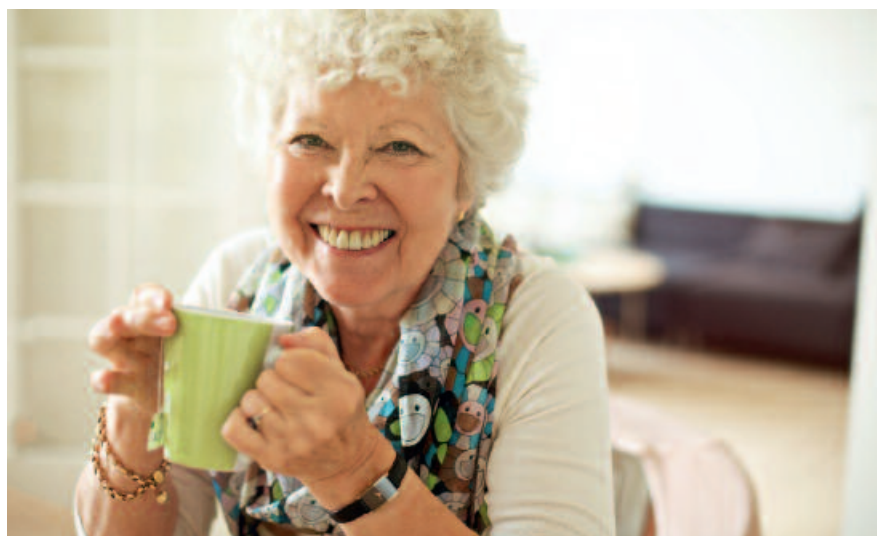
In der kalten Jahreszeit tut Tee gut – ohne Zucker auch dem Mund.

Viele Senioren leiden unter Mundtrockenheit. Dies beeinträchtigt die Zahngesundheit, denn Speichel schützt die Zähne: Er wirkt antibakteriell und neutralisiert Säuren.