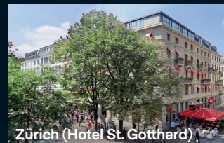
Zürich (Hotel St. Gotthard)